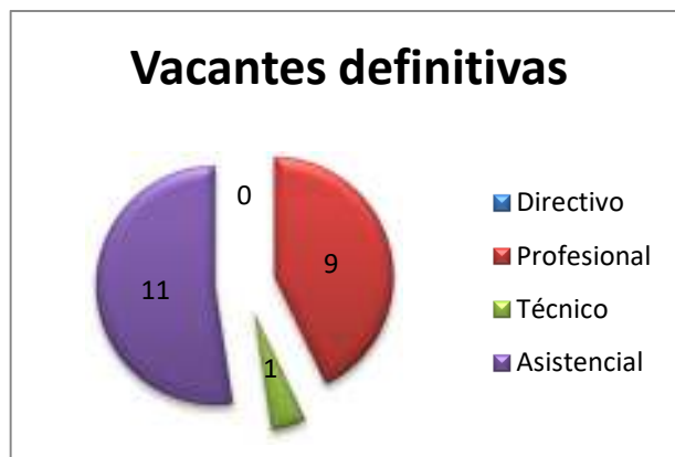
Tabla 2. Vacantes definitivas planta de cargos por niveles

Con corte a 30 de noviembre de 2021, de los 38 cargos de la planta de personal establecida, 21 empleos se encontraban vacantes y 7 empleos estaban provistos, así: